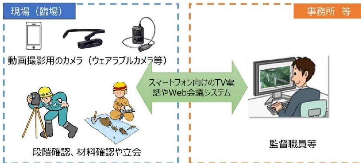
図 2-1 機器構成（例）