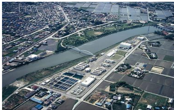
十日市場浄水場 (処理能力 60,000 m 3 /日)