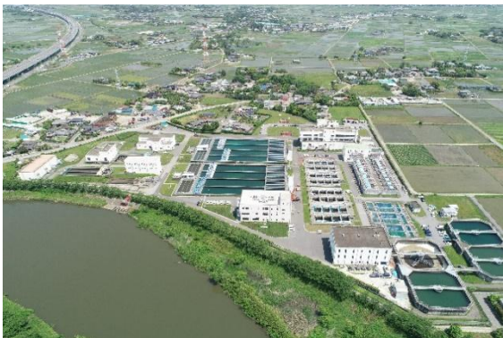
大寺浄水場 (処理能力 116,000 m 3 /日)