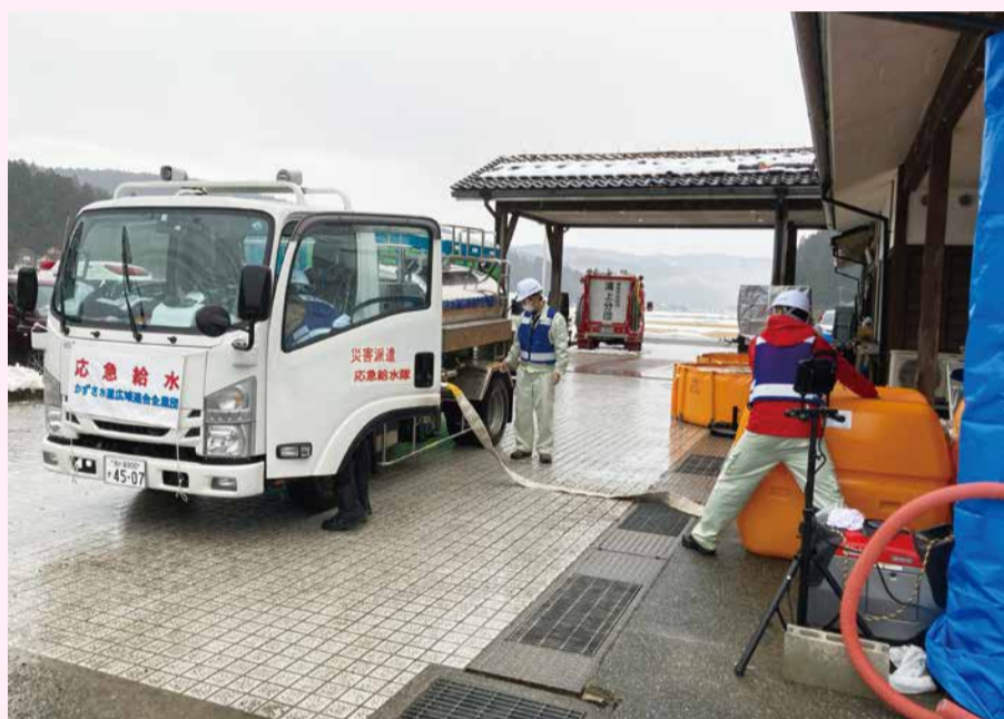
輪島市立浦上公民館