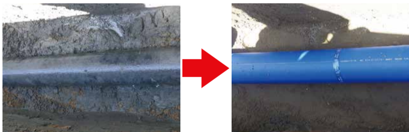
工事前後の様子 昭和45年に敷設した石綿管をポリエチレン管に入れ替えました

工事に伴う騒音や振動、通行規制などでご迷惑をおかけしますが、ご理解とご協力をお願いいたします。