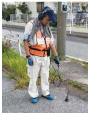
漏水音探査の様子

見つけたらすぐに、浄水2課 ☎ 0438-23-0743にお電話ください。 (24時間対応)