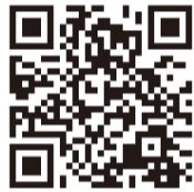
▲指定給水装置工事事業者リストはこちらから

新築・増築・取り壊しなどの際に、水道工事を行うときも、同様に指定給水装置工事業者に依頼してください。