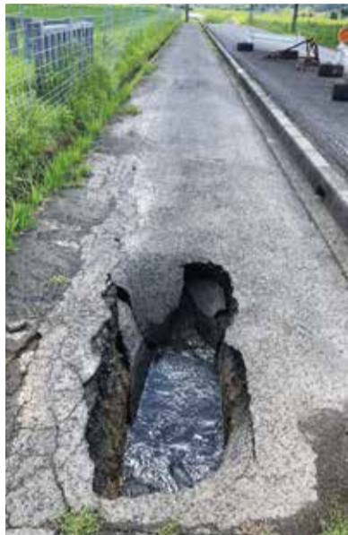
漏水が原因で陥没した道路

この調査では必要に応じて宅地内の給水管を調査させていただく場合がありますので、皆様のご協力をお願いします。