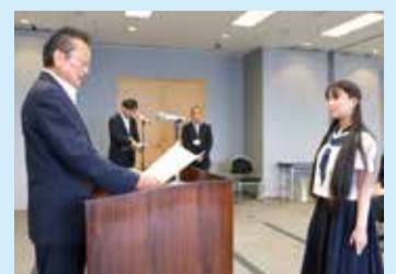
令和元年度 千葉県表彰式の様子