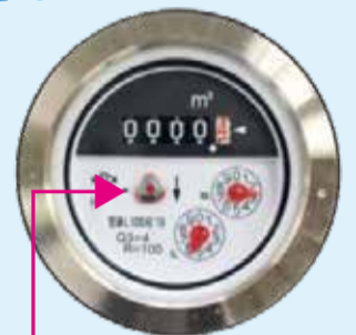
メーターパイロット この動きを見てください

また、修理までの間に水道を使わないときは、水道メーターボックス内のハンドル（止水栓）を回して、いったん止めると、漏水量を減らすことができます。