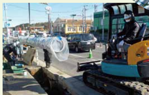
◀新しい水道管に取り替えようとしている様子