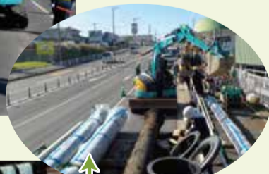
←古い水道管 ←新しい水道管