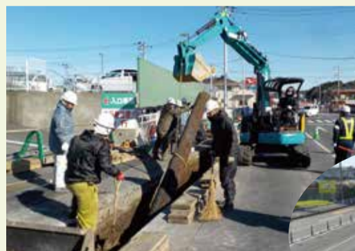
◀古い水道管を取り外している様子

工事完了直後は、蛇口から白い水が出てくる場合がありますが、水道水に溶け込んでいる空気が気泡になるためです。この気泡は非常に小さいため、水が白く濁って見えますが、しばらく水を流しておくと白い濁りはなくなりますので、飲用しても問題ありません。